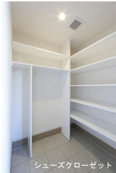
シューズクローゼット