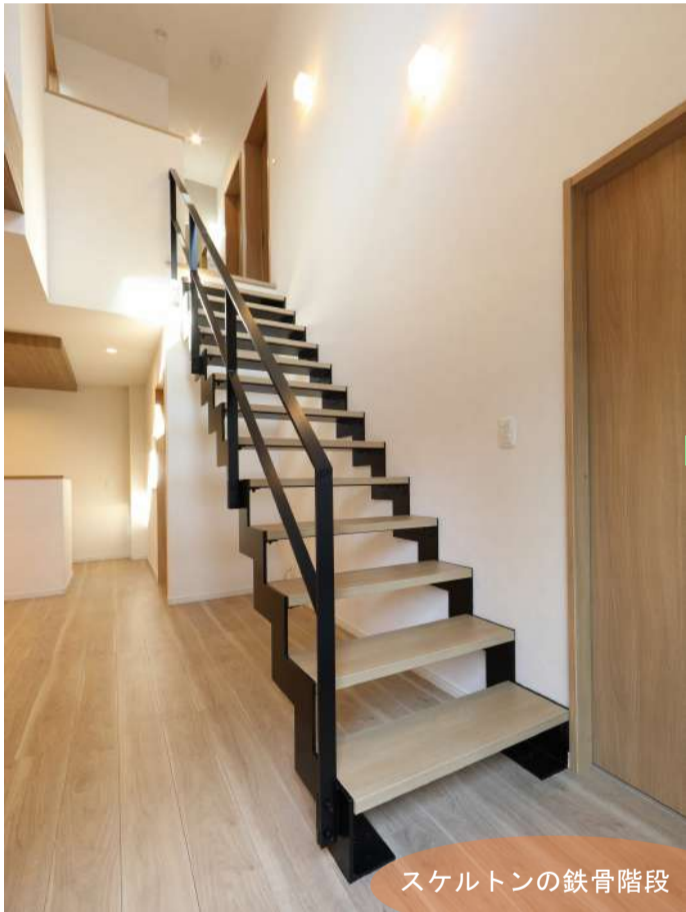
スケルトンの鉄骨階段