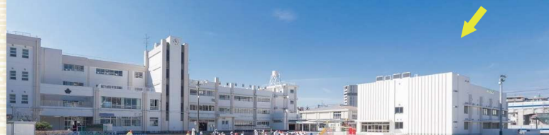
昭和25年創立の川崎市東住吉小学校

対象基準となった中原区川崎市東住吉小学校 右側のB棟増築棟を建築 鉄筋コンクリート造3階建て 延床面積；1,925.49㎡ 工期；令和元年12月～令和3年2月竣工