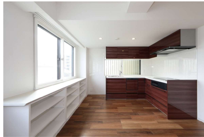
▲パントリーとして収納棚が充実しているL型のシステムキッチン回り

ワンフロア開放型は車椅子の動線に支障が無く、スムーズに行き交うように幅を確保。間仕切り壁を極力なくし、スライディングパーテーションで開閉するようにしました。開放された室内は圧迫感のない心地いい空間となりました。