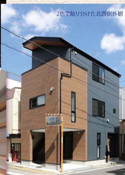
2色で貼り分けた北西側外観