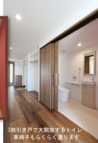
3枚引き戸で大開放するトイレ 車椅子もらくらく通ります