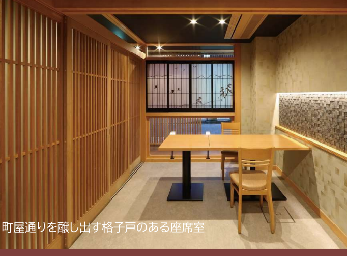
町屋通りを醸し出す格子戸のある座席室

金沢の格式ある町をイメージする縦格子が、凛とした佇まいを感じさせ店内へ誘います。板張り床の玄関と古風な松の装飾窓から、店内の落ち着いた様子が伺えます。見せる化粧柱・梁は漆、壁紙の金箔と凹凸の市松タイルが、落とされた光でデザイン豊かな表情を演出しています。奥にはカウンターが設けられ、ひとりでランチを食べる丁度いいスペースです。人数に合わせてパーティションで仕切ることができ、6人~12人の会食も楽しめます。スケルトン状態よりヴィンテージ風合いを醸し出す本格的な日本料理店となりました。