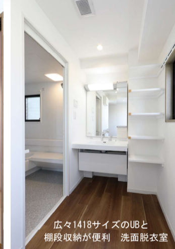
広々1418サイズのUBと 棚段収納が便利 洗面脱衣室