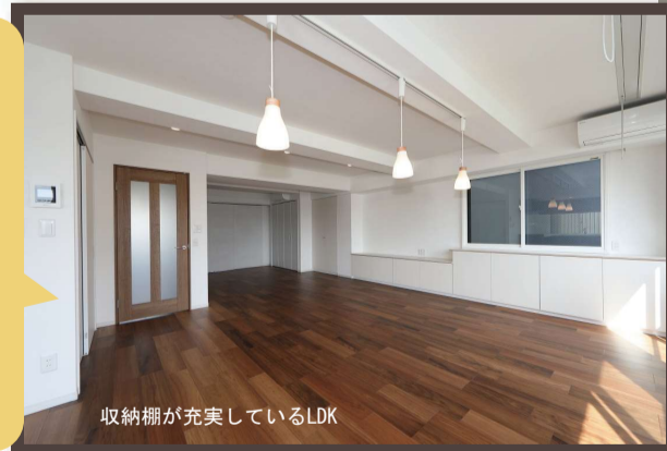
収納棚が充実しているLDK

元は事務所を居住空間に改修 既存の窓位置を活かしながらの 収納たっぷりのプランとなりました。