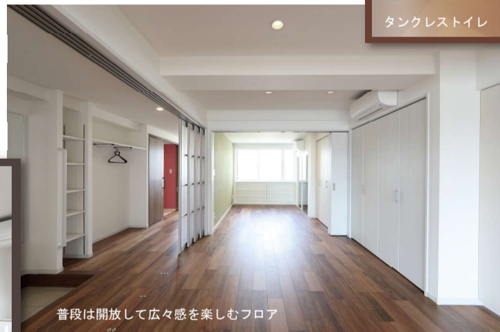
普段は開放して広々感を楽しむフロア

ワンフロア開放型は車椅子の動線に支障が無く、スムーズに行き交うように幅を確保。間仕切り壁を極力なくし、スライディングパーテーションで開閉するようにしました。開放された室内は圧迫感のない心地いい空間となりました。