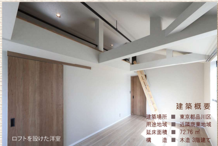
ロフトを設けた洋室