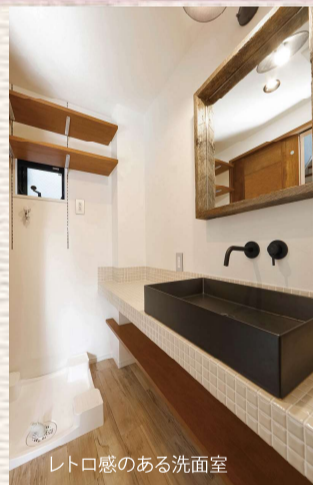
レトロ感のある洗面室