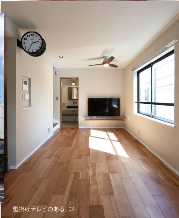
壁掛けテレビのあるLDK