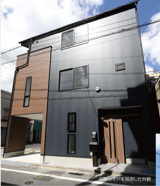
玄関引き戸を採用した外観