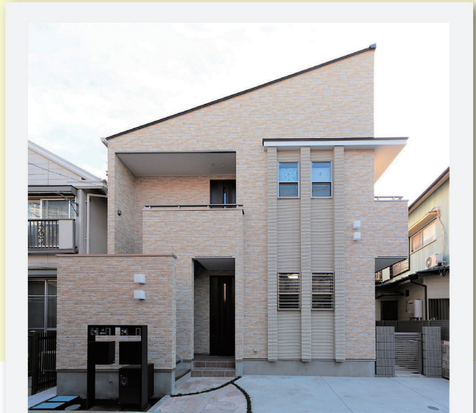
重層長屋の二世帯住宅はやさしい色使いで風格がある。

繁華街通りの裏手にある住宅に囲まれた閑静な一等地。外部階段で分かれた片流れ屋根の二世帯住宅は、近隣に暖色系の外壁でシンプルにアピールしています。上下階と同様の間取