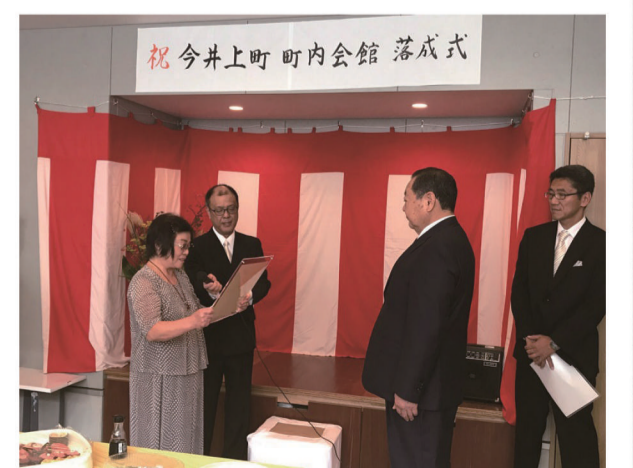
今井上町町内会館落成式

私ども興建は、おかげさまでこの度、創業40周年を迎えることができました。これもひとえに皆様からの信頼とご支援の賜物と、心より感謝申し上げます。創業40周年の記念事業として、今井上町町内会館建設への協力、地域イベントへの協力・協賛、武蔵中原駅連絡通路のネーミングライツ（命名権）等、さまざまな事業を実施して参りました。これからもお客様に寄り添った地域貢献事業を推進するとともに、次代を見据えた、お客様に喜ばれる更なるご提案を行っていききたいと思います。