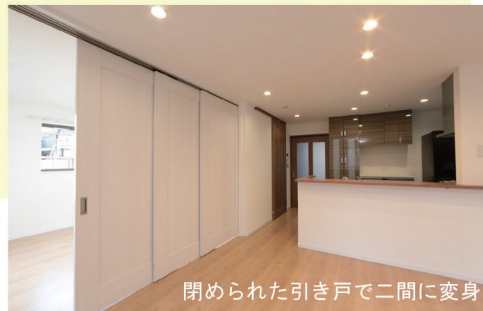
閉められた引き戸で二間に変身