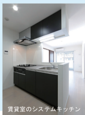
賃貸室のシステムキッチン