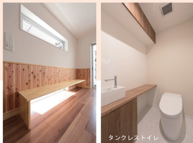
タンクレストイレ

▲猫ちゃんたちの視線の高さに合わせた床からの窓は、みんな寄り添って日向ぼっこをしています。