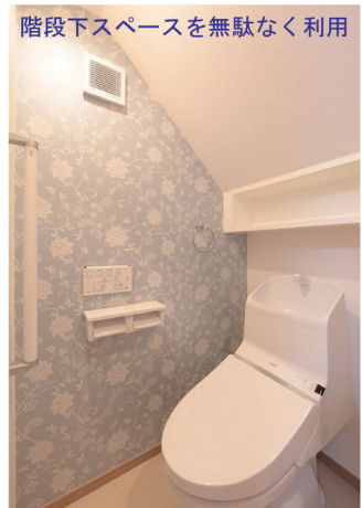
階段下スペースを無駄なく利用

して安全面を計りました。外に洗い場があるのは嬉しいスペース。玄関扉は出入りしやすい引き戸を採用。2階のLDKは金魚の水槽置場。皆が見やすい通路の位置に決め憩いの場としました。温水式床暖房は厳しい冬に大活