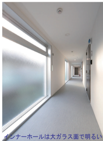
メインホールは大ガラス面で明るい