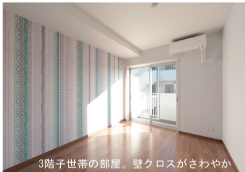
3階子世帯の部屋。壁クロスがさわやか