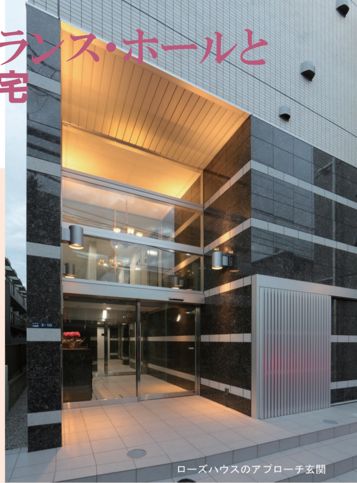
ローズハウスのアプローチ玄関