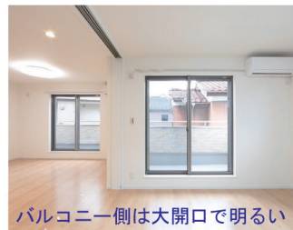
バルコニー側は大開口で明るい

親室は1階を利用。室内はバリアフリーで手摺棒を設け、明るい色を主体にした仕様は、居間の間仕切りを3枚引込み戸で開閉でき、普段は広々とした空間で使い勝手よく居住できます。無駄なく考えられた水回りとなつぷりの収納も充実し、動線も最小限に抑えた工夫をしています。2階は子供世帯が住み、同様のプランは下層の壁量を通し耐震性を高めています。小屋裏を利用したロフト階は、固定階段で昇降しやすく、1.5帖ほどの広いスペースがあり多様なスペースで利用されていきます。