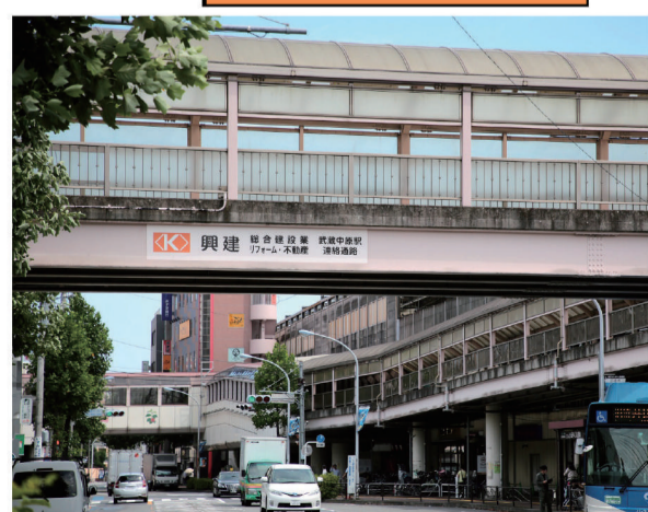
武蔵中原駅連絡通路のネーミングライツ