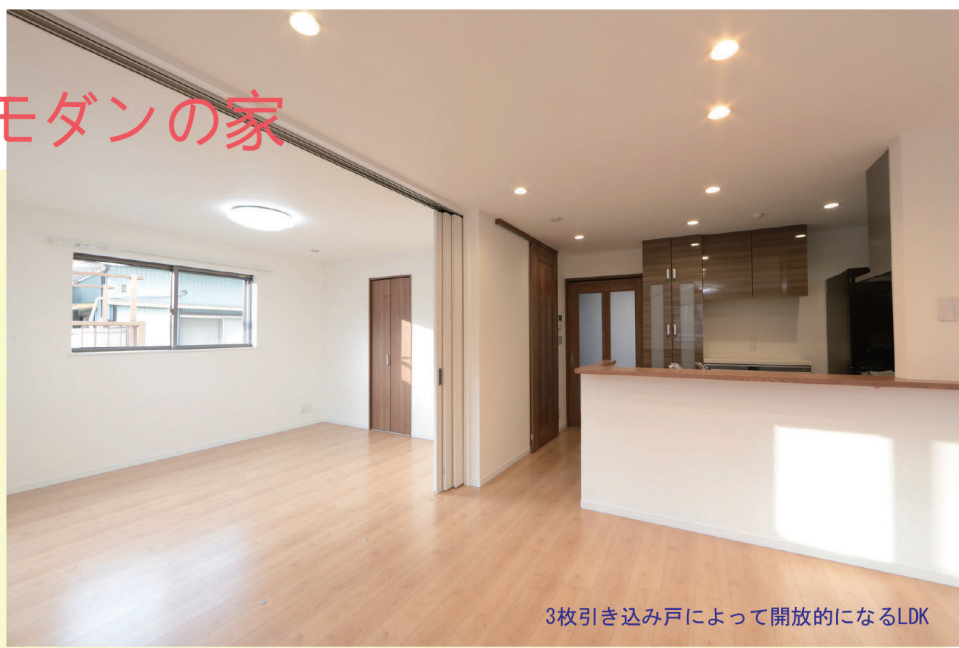
3枚引き込み戸によって開放的になるLDK