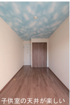
子供室の天井が楽しい