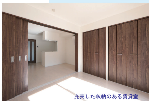
充実した収納のある賃貸室

エントランス・ホールはふんだんにガラス窓を使い、閉鎖的にならず明るい開放的な雰囲気です。玄関ホールは大吹抜けにお洒落なシャンデリアで住人を迎えます。セキュリティは完全オートロックで安心面を約束しています。顔となる玄関回りはモノトーンの重厚な御影石。道路面のステンレス製のスリット縦格子の奥は実はゴミの集積場。見せない工夫で、お洒落感漂う建物が街にまたひとつ誕生しました。