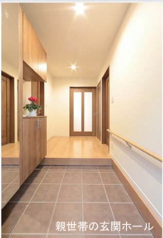
親世帯の玄関ホール