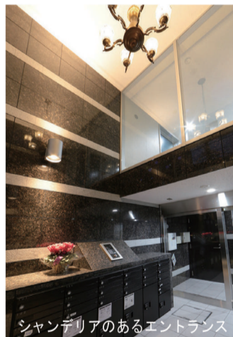
シャンデリアのあるエントランス

以前は赤レンガ風の外観を呈していたローズハウスは、建て替えとともにスタイリッシュなマンションに生まれ変わりました。お客様がこだわったのは、青空に映える白い外装とペット達の共同生活。1階に住むオーナー様の部屋には13匹の猫ちゃんと1匹のワンちゃんが同居しています。ペットの寄り合う場所となるリビングには、日向と庭を望める高さの窓を設け