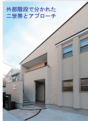
外部階段で分かれた二世帯とアプローチ