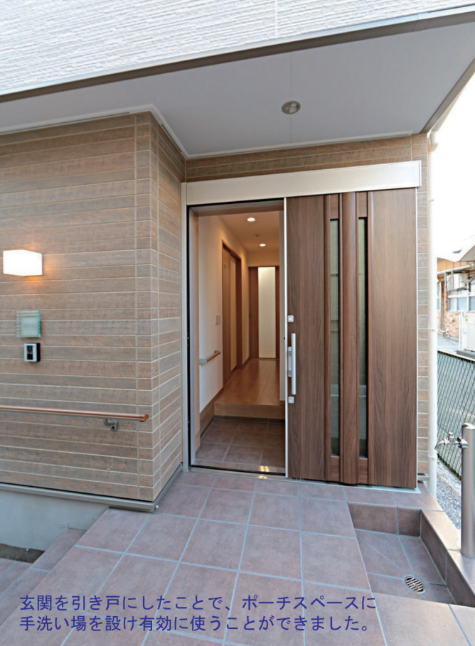
玄関を引き戸にしたことで、ポーチスペースに手洗い場を設け有効に使うことができました。